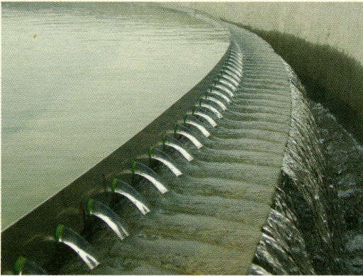
工業用水施設と廃水処理施設