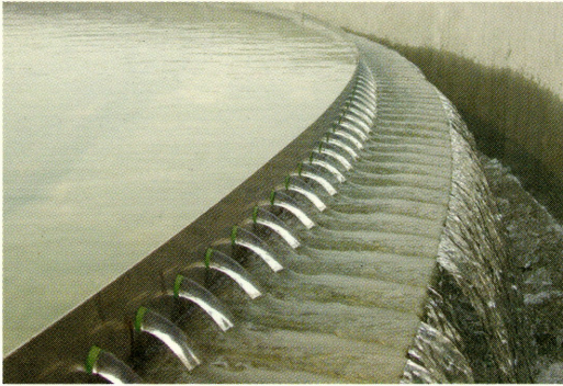
Water Supply & Waste Water