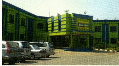
プライム・ビズ・ホテル