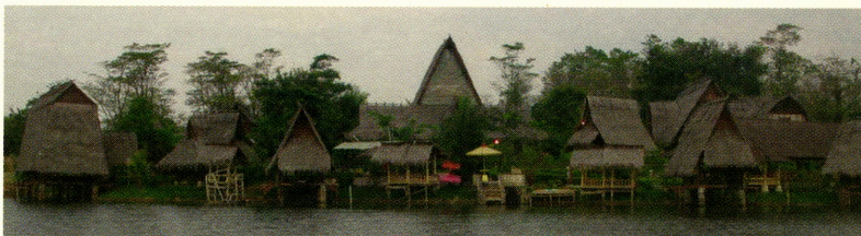
Seafood & Sundanese Restaurants