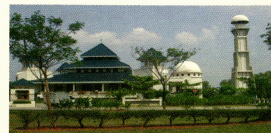
Bukit Indah Grand Mosque