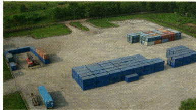
コンテナ・ヤード