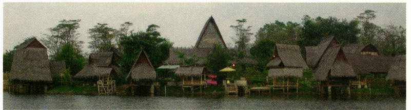
シーフードとスンダ料理レストラン