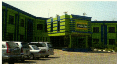
Prime Biz Hotel