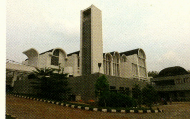
Santa Maria Catholic Church