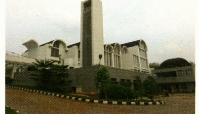
サンタ・マリア・カトリック教会