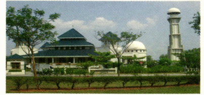
ブキット・インダ・モスク